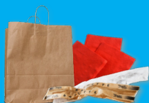
Serviettes et sacs en papier vides