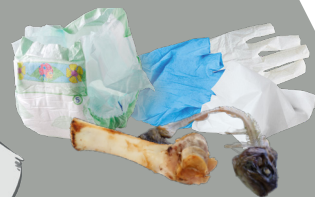
Couches, gants, lingettes, os, arêtes, ...