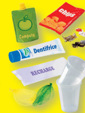
Autres emballages en plastique