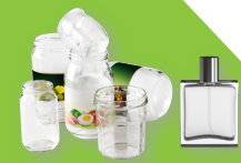
Pots, bocaux, flacons