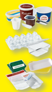
Barquettes et pots