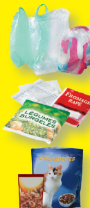
Films et sacs