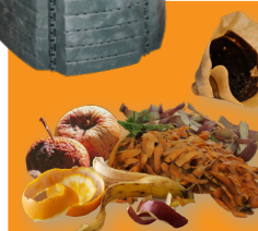
Marc, filtres à café et sachets de thé