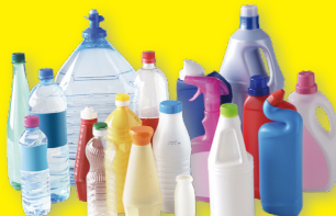
Emballages en plastique